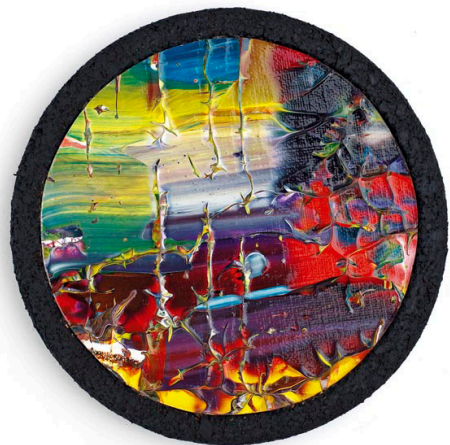
Hans Schöpfer, Nordic light symphony, 2009